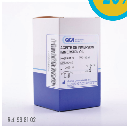
Ref. 99 81 02