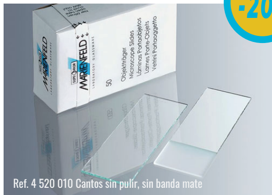
Ref. 4 520 010 Cantos sin pulir, sin banda mate

Portaobjetos para microscopio, Marienfeld. Caja 50 Uds.